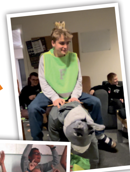
Indtoget i Jerusalem Palmesøndag

Vil du vide mere om foreningen, kan du læse og se mere på Facebook: Asp KFUM og KFUK eller kontakte en fra bestyrelsen.